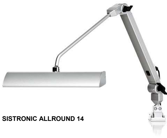
SISTRONIC ALLROUND 14