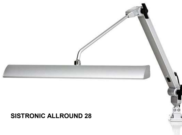
SISTRONIC ALLROUND 28

für Löt- und Prüfarbeitsplätze, feine Montagetätigkeiten und Handarbeitsplätze oder als Nähmaschinenleuchte – die Gelenkleuchte SISTRONIC ALLROUND ist eine vielfach bewährte Universalleuchte mit homogenem Flächenlicht für Arbeitsplätze mit normalen Umgebungsbedingungen und hohem Lichtbedarf